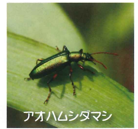
アオハムシタマシ