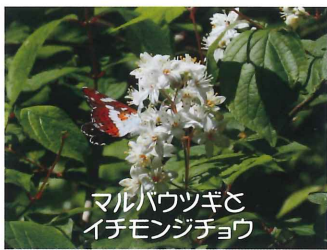
マルバウツギと イチモンジチョウ