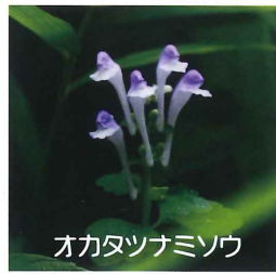
オカタツナミソウ