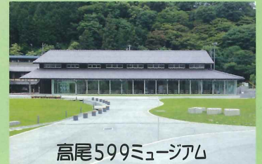
高尾599ミュージアム