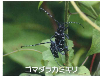
ゴマダラカミギリ