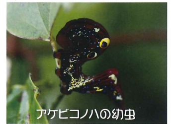
アケビコノハの幼虫

「冒険」の名前のとおり、子どもたちに豊かな森と渓流の自然のなかで遊びながら、自然に親しむ体験ができます。また自然の中で、自分の身を守ること、他人にケガをさせない、仲間を守るということを学び、野外での「安全」の意識を身につけて、日常に活かす体験ができればと思います。